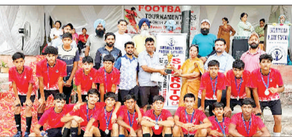
महेंद्रगढ़। टूर्नामेंट के साथ आरपीएस के खिलाड़ी।