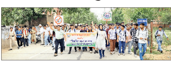
नारनौल। जागरूकता रैली में हिस्सा लेते हुए।