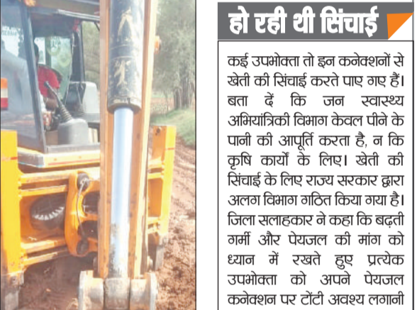
नारनौल। अवैध कनेक्शन काटती विभाग की टीम व खुदाई करती मशीन।