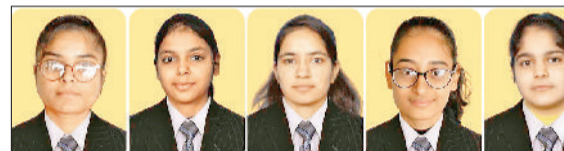
महेंद्रगढ़। सफलता प्राप्त करने वाले विद्यार्थी।