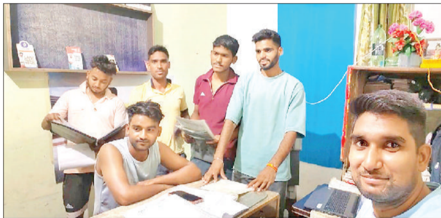
नारनौल। सीएचसी सेंटर में आवेदन करते आए युवा।

हरियाणा कर्मचारी चयन आयोग की ओर से आयोजित कॉमन एलिजिबिलिटी टेस्ट के आवेदन को लेकर युवाओं में भारी रोष और निराशा देखी जा रही है। एक तरफ जहां आवेदन की अंतिम तिथि नजदीक आ रही है वहीं दूसरी ओर सरल पोर्टल की धीमी गति और लगातार तकनीकी खराबी ने अभ्यर्थियों की चिंता बढ़ा दी है। युवाओं ने मुख्यमंत्री नायब सिंह सैनी से सीईटी आवेदन की अंतिम तिथि बढ़ाने और पोर्टल को सुचारु रूप से चलाने की तत्काल