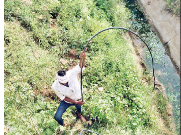
नारनौल। अवैध कनेक्शन काटती विभाग की टीम व खुदाई करती मशीन।

गांवों और शहरों में अनेक उपभोक्ता ऐसे हैं, जो पेयजल का उपयोग पीने के अलावा बगीचों की सिंचाई, यहां तक कि खेतों की सिंचाई के लिए भी कर रहे हैं। वाटर ट्रीटमेंट प्लांट से बूस्टिंग स्टेशन तक पानी पहुंचाने के लिए जो मैन लाइन बनाई गई है, उसमें कई उपभोक्ताओं ने मनमाने ढंग से सुराख कर अवैध रूप से कनेक्शन ल रहे हैं। इसके कारण गांवों की सफाई के लिए बने बूस्टर्स में पर्याप्त मात्रा में पानी नहीं पहुंच पाता। विशेष रूप से निजामपुर और नांगल चौधरी क्षेत्र