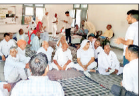
महेंद्रगढ़। किसानों को जानकारी देते विशेषज्ञ।