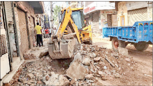
महेंद्रगढ़। चबूतरे तोड़ती जेसीबी मशीन।

नगर पालिका की ओर से मंगलवार को अवैध निर्माण पर बुलडोजर चला है। शहर के माता मसानी की ओर जाने वाले बाजार से अतिक्रमण हटाने को लेकर नगर पालिका ने कार्रवाई की है। कई दुकानदारों ने अपने आप अतिक्रमण हटाना शुरू कर दिया। दोपहर दो बजे के बाद नपा के कर्मचारी जेसीबी मशीन के साथ भगवान