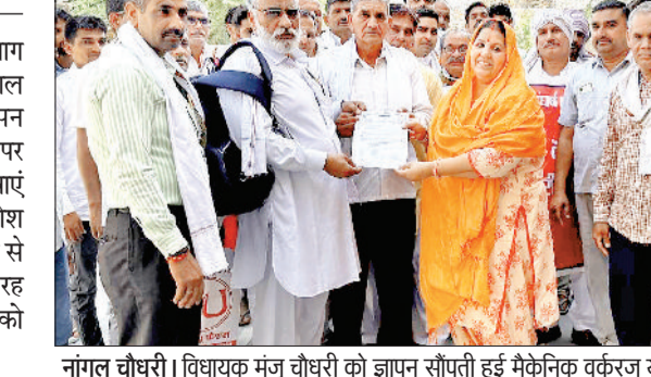
नांगल चौधरी। विधायक मंजू चौधरी को ज्ञापन सौंपती हुई मैकेनिक वर्कर यूनियन।

उन्होंने कहा कि कर्मचारियों की विभिन्न समस्याओं को लेकर जनवरी 2025 में मुख्यमंत्री से मुलाकात की गई थी, जिसमें एचआरकेएन कर्मचारियों की जाँब गारंटी