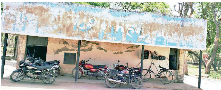
महेन्द्रगढ़। जनस्वास्थ्य कार्यालय महेन्द्रगढ़।

जवाहर लाल केनाल में बुधवार को पानी आएगा। जनस्वास्थ्य विभाग की ओर से दो दिन टैंक भरकर शहर में नियमित रूप से पेयजल सप्लाई की जाएगी। शहर में शुरुवार से 18 दिन नियमित पेयजल सप्लाई होगी। बता दें कि महेन्द्रगढ़ शहर पूरी तरह से नहरी पानी पर निर्भर है। देवास जलघर से पानी को शहर के अलग-अलग हिस्सों में बने सात बूस्टिंग स्टेशन में भेजा जाता है। यहां से अलग-अलग कॉलोनियों में पानी आपूर्ति होता है। इस बार महेन्द्रगढ़ जिला में निर्धारित शेड्यूल से छह दिन में नहरी पानी मिला है। ऐसे में शहर के लोगों को पेयजल किल्लत