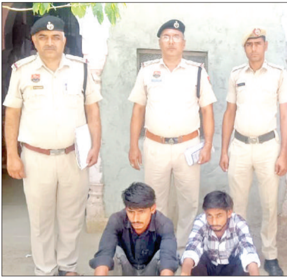
नारनौल। पुलिस गिरफ्त में आरोपित।

थाना निजामपुर की पुलिस टीम गश्त के दौरान छिलरो बस अड्डा पर मौजूद थी, टीम को गुप्त सूचना मिली कि एक मोटर साइकिल पर फर्जी नंबर प्लेट लगाई हुई है, जिसका असल नंबर